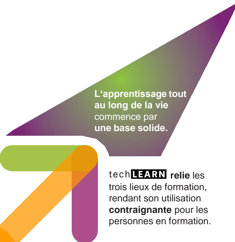
Lieu de formation Cours interentreprises

L'apprentissage tout au long de la vie commence par une base solide.